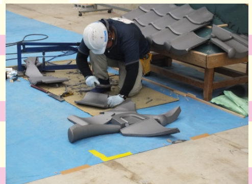
技能検定実技風景(瓦)

当学院は、各専門技能職への就職が条件となっておりますが、各専門技能職が会員の熊本市産業開発求人対策協議会と連携を行い、求人事業所の開拓活動を実施しております。 そのため、就職が見つからない場合は、協議会会員の事業所と連絡を密にとりながら、求人情報を提供致します。