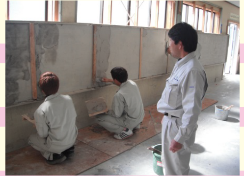
実技指導風景(左官)

当学院に在籍している職業訓練指導員は、各専門コースにおける国家検定1級技能士を有しており、また、当学院会員団体により推薦を受けた者が、直接指導致します。 各科専門職種に分かれて実技を行うため、少人数となり、マンツーマンでの指導が期待されます。