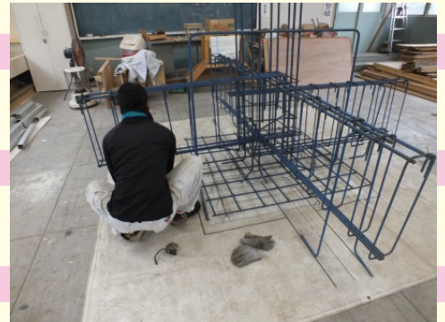
技能照査実技風景(鉄筋)

当学院の修了時に技能照査を実施し、合格すると技能士補という称号が与えられます。技能士補の称号を取得すると、技能検定2級の学科が免除され、実技試験のみで資格を取得することが出来ます。また、実技試験は、すべて2年間の在学中に学ぶことが出来るので、ほぼ100%の訓練生が、卒業後資格を取得しております。