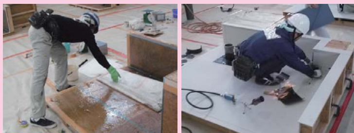
～建築物の漏水を防ぐ～

建設業は、現在 28 職種の専門業種に分かれております。その中には、建築一式を行う事業所のほかに、左官、型枠、鉄筋、建築塗装、防水、屋根、建具、とび、板金など専門的な業種の施工により建築物が建てられています。